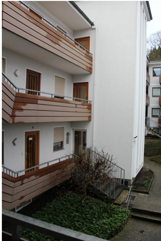
Ausblick von der Wohnungseingangstür