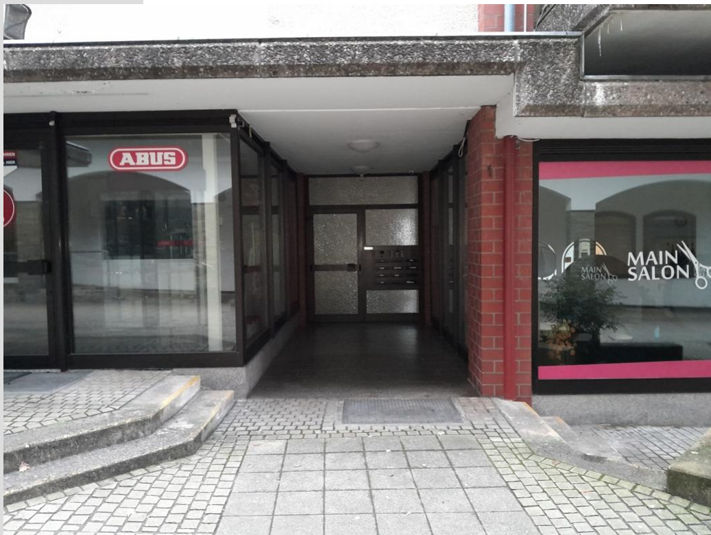
Gewerbe Schlüsseldient und Friseur