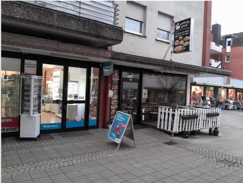
Gewerbe Fotografgeschäft und Pizzeria