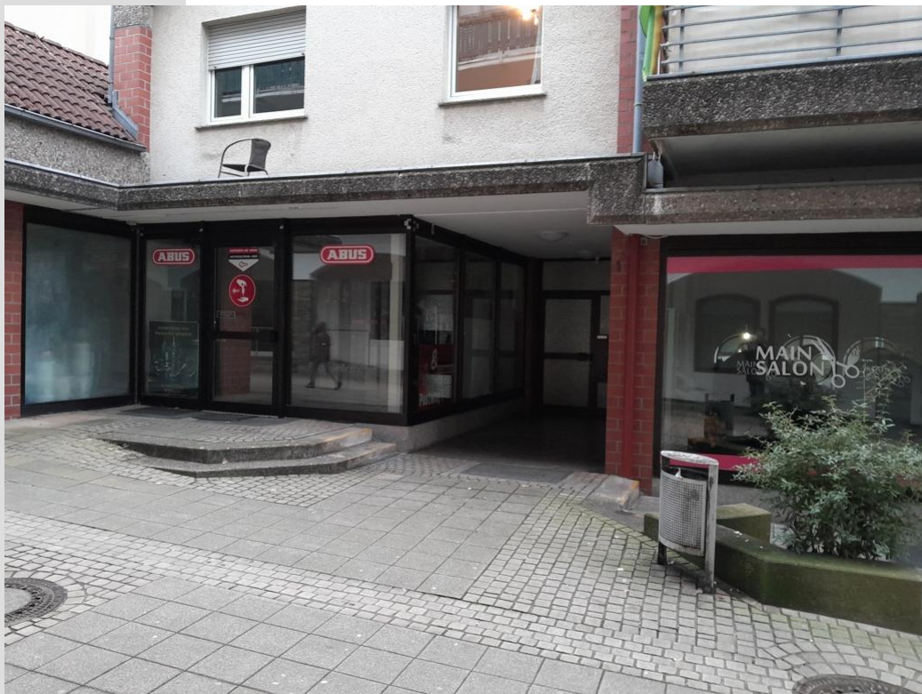
Gewerbe Schlüsseldienst und Friseur