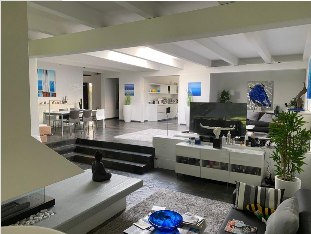
Untere Wohnebene mit Kamin