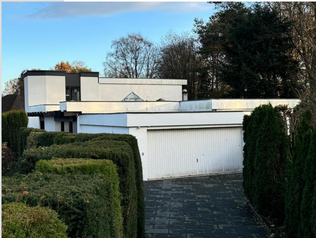
Auffahrt, Sicht auf Garage