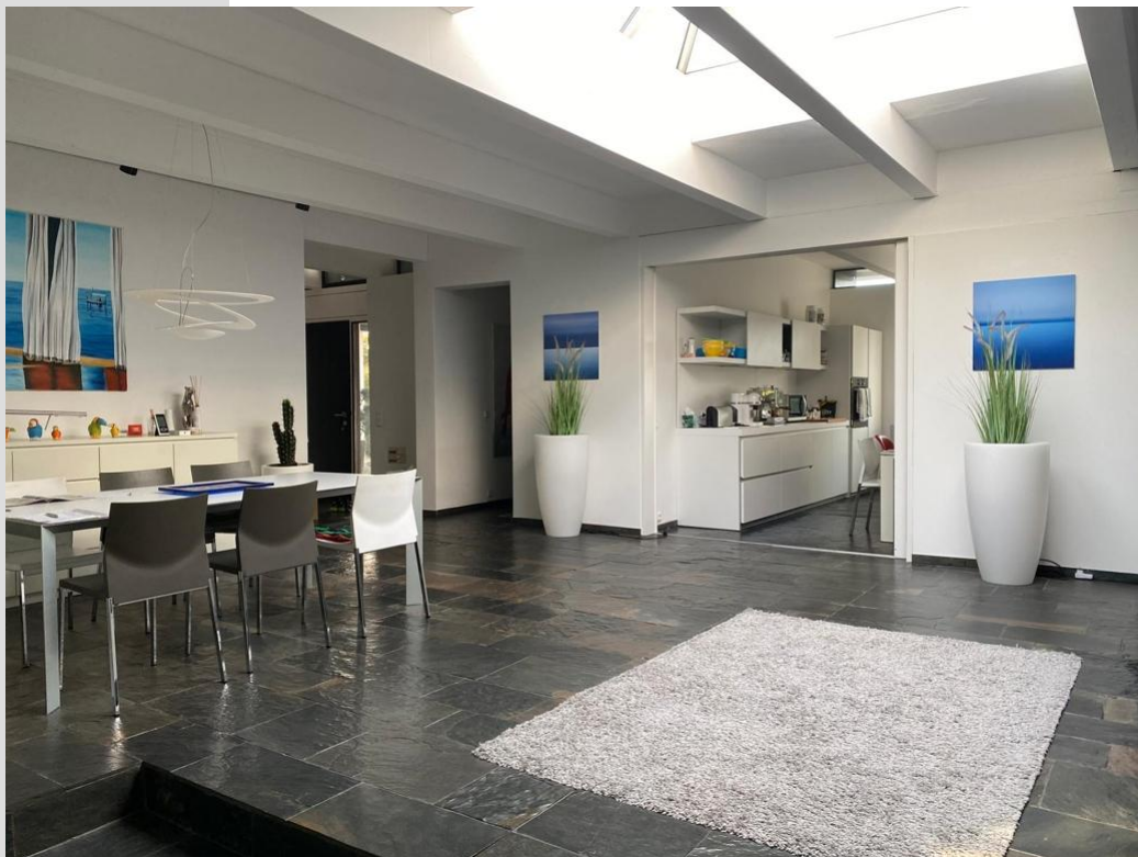
Blick auf Essplatz Küche