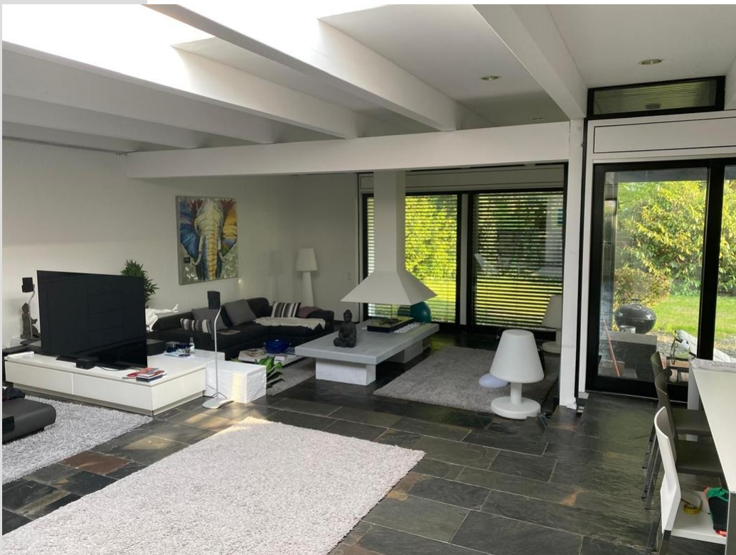
Blick auf untere Wohnebene mit Terrassenausgang